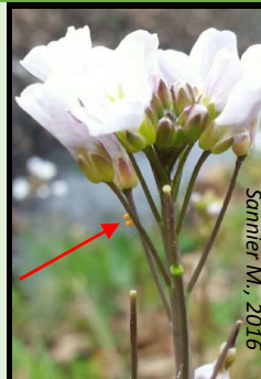
Œufs sur Cardamine des prés

Leur forme (oblongue) et leur couleur (verte à orange-brun selon la maturation) sont caractéristiques.