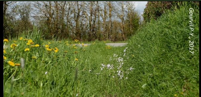
Bord de route à Cardamine des prés

A rechercher dans les milieux ouverts humides où poussent la Cardamine des prés ou diverses brassicacées : prairies de fond de vallon, clairières, bords de champs et de routes, bords de fossés humides.