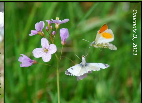
Couple d'aurores paradant autour d'une Cardamine des prés